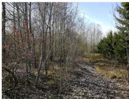
Foto 6 Vaade kinnistu põhjapiirile.

Teedest ja hoonestusalast väljaspool olev kõrghaljastus on soovitatav maksimaalselt säilitada. Kuna teemaa ja kruntidele sissesõidutee, parkla osas teostatakse lageraiet, siis antud alas on III väärtusklassi puid vaid 16 tükki ja need on 2 kuldkaske, 1 harilik vaher, 7 harilikku saart, 6 harilikku toomingat. Elamumaa kruntide hoonestusala piires likvideeritavad puud määratakse hoone projekti käigus. Puude likvideerimisel tuleks teostada asendusistutus, võttes arvesse maaüksuse haljastuslike kui ökoloogilisi aspekte.