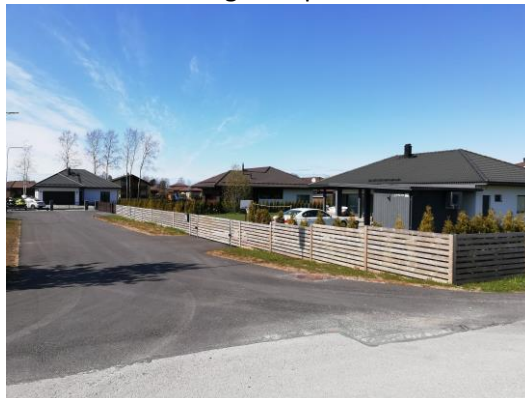
Foto 2 Jaanivälja põigu elamud