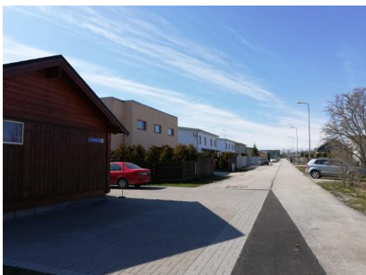
Foto 1 Roosipõõsa tee äärsed elamud

Kontaktvööndi hoonestus on eriilmeline, kuid valdavalt viilkatustega ühepereelamud.