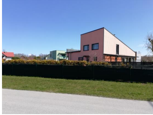
Foto 4 Lepiku tee 11a elamu