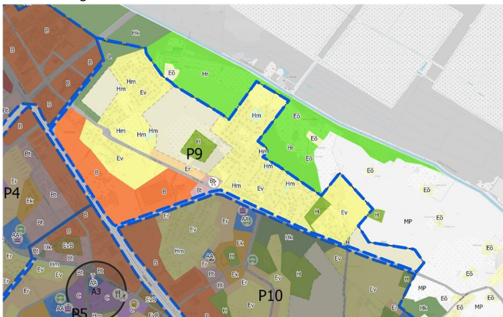
Joonis 1 VÄLJAVÖTE P9 RAE PÕHJAPIIRKONNAST

Detailplaneeringu koostamise eesmärk on kooskõlas Rae valla põhjapiirkonna üldplaneeringuga, kehtestatud Rae Vallavolikogu 15.10.2024 otsusega nr 134. Rae põhjapiirkond on üleminekuala linnaliselt keskkonnalt looduslikule. Ala on kogu ulatuses ette nähtud hoonestada vaid väikeelamutega.