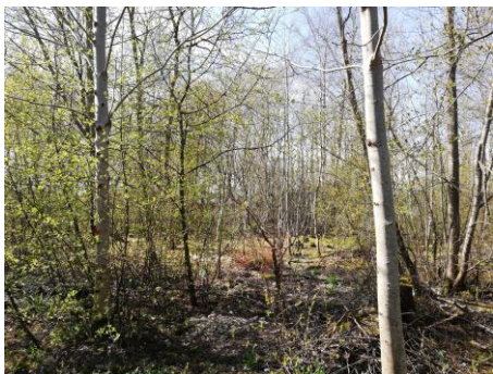
Foto 5 Vaade kinnistul kasvavatele puudele

Detailplaneeringu ala moodustatud teemaa ja elamumaade hoonetus aladele on teostatud Arbomare OÜ poolt „Jaanisalu kinnistu osaline haljastuse hinnang“, mille tulemusel antud alal kasvab põhiliselt harilik toomingas, hall lepp, harilik pihlakas, harilik saar, kask ning harilik haab. Ühtegi väga väärtuslikku ja kindlasti säilitamist väärt puud hinnatud puude seast ei leitud. Metsale iseloomulikult on Jaanisalu kinnistul kuivanud, ümber kukkunud, murdunud puid ja võsa. Kõige jämedam puu on 29cm läbimõõduga kuldkaask. Enamus puid on 10 - 20cm läbimõõduga noored puud. Säilitada tasub noori terveid puid, millel on olnud ruumi kasvada ühtlase võraga sirgeks puuks.