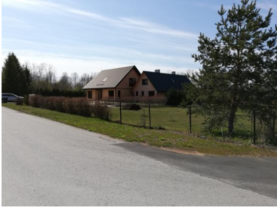
Foto 3 Jaanivälja tee 1a elamu