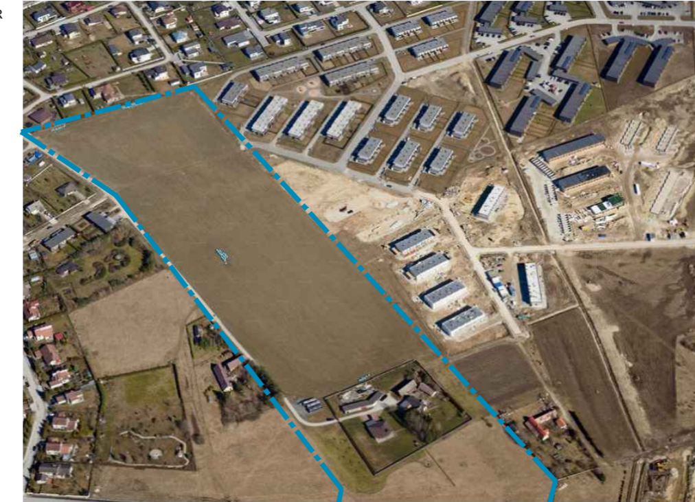
VAADE PLANEERINGUALALE LÕUNAST