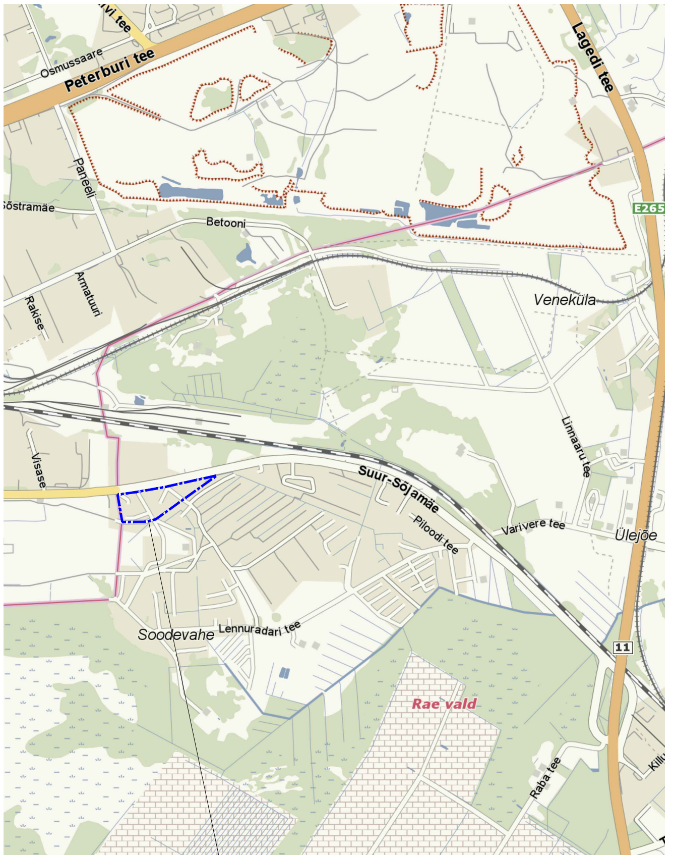
Planeeritud ala asukoht

Trükkis: KPR-KATARINA Fail: U:\OBJEKTID\21010 Suur-Sõjamäe 60 DP\Joonised\21010_Asukohaskeem.dwg Trükitud: 07.10.2022