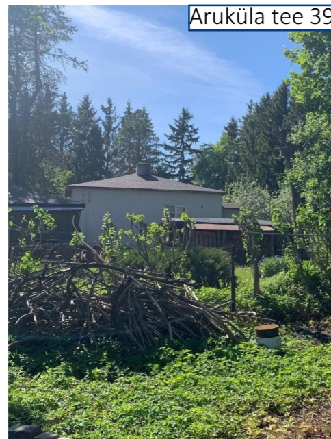
Aruküla tee 39