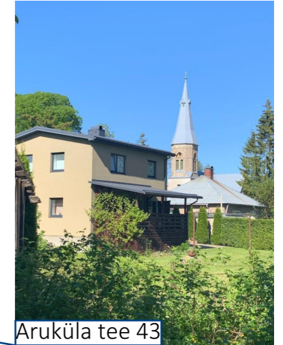
Aruküla tee 43