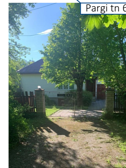
Pargi tn 6

MiHo OÜ Registrikood: 11344754 Reg.nr: EEP000998 Pae 25-33 Tallinn phone: +372 56 642 338 email: kristina@miho.ee