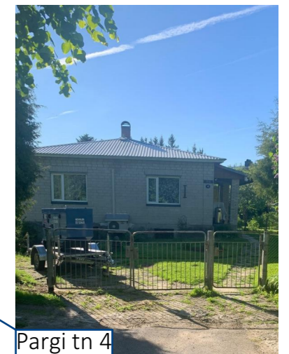
Pargi tn 4