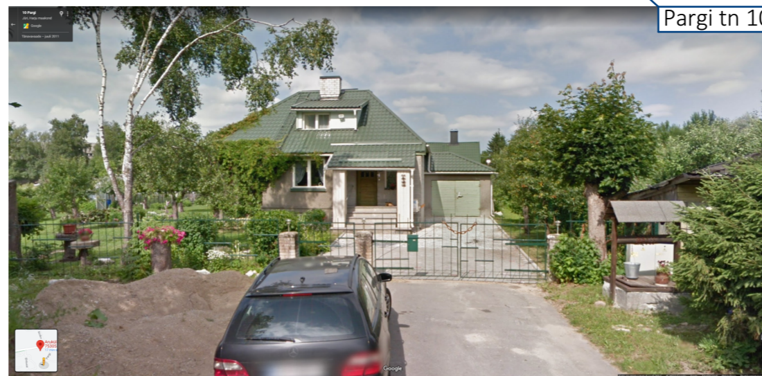
Pargi tn 10