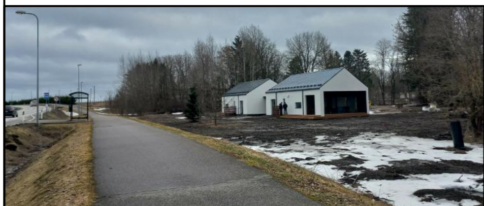
FOTO 1 - KERGLIIKLUSTEE, OOTEPAVILJON JA UUSHOONESTUS