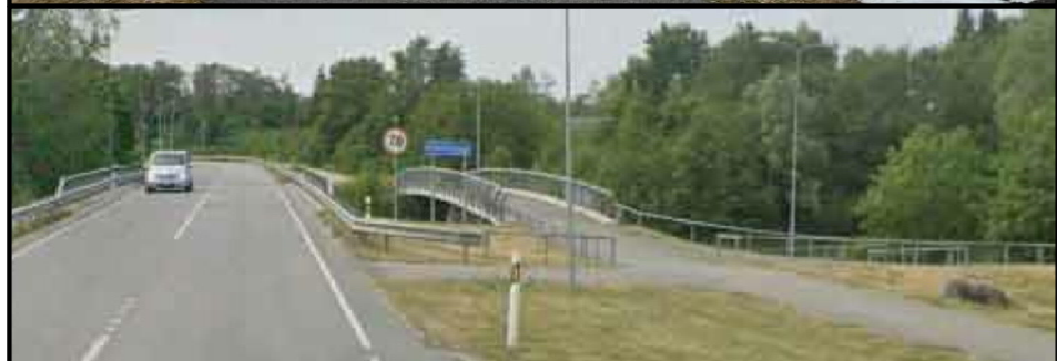
FOTO 2 - MAANTEE SILD JA KERGLIIKLUSTEE SILD