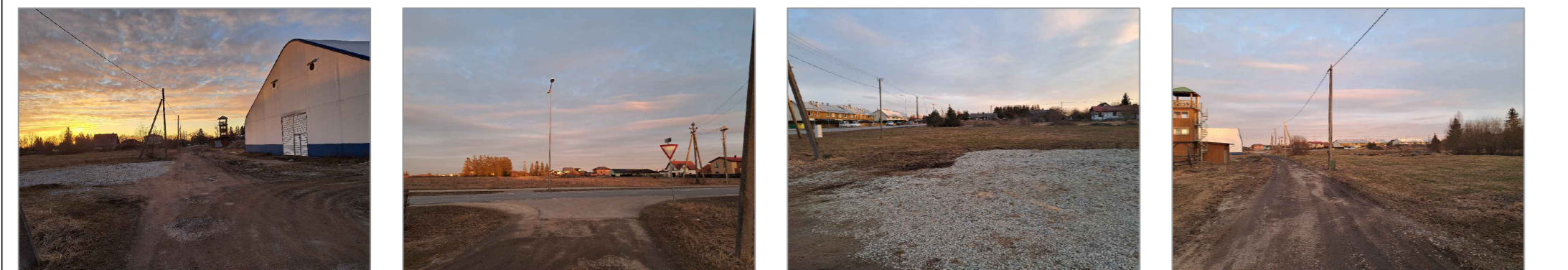
Vaade Kingu tänavale ja planeeringualale Vaade Kingu tänavalt 11302 Lagedi-Kostivere teele (Linnu tee) Vaade Kingu tänavalt planeeringualale Vaade Kingu tänavale ja planeeringualale