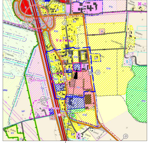
PLANEERITAV ALA Olemasolev ühiskondlike ehitiste maa (AA)