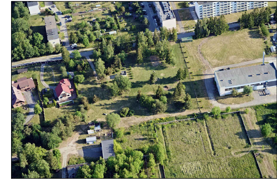
Vaade lõunast Rukkilille tn 6 krundile / kaldaerofoto

MÄRKUSED: 1. Detailplaneeringu seletuskiri on jooniste lahutamatu lis.