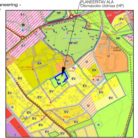
VALJAVÕTE RAE VALLA, JÜRI ALEVIKU JA SELLEGA PIIRNEVATE AAVIKU, VASKJALA JA KARLA KÜLAOSADE ÜLDPLANEERINGU PÕHIJONISEST