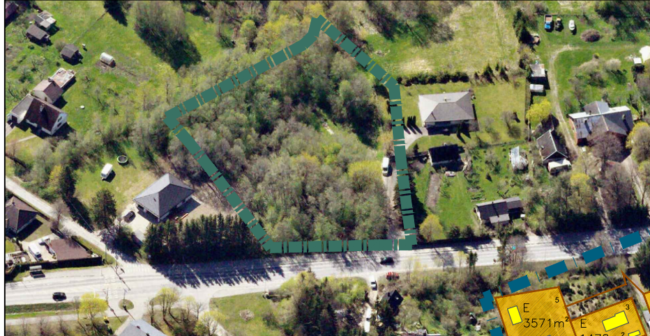
VAADE PLANEERINGUALALE PÕHJAST