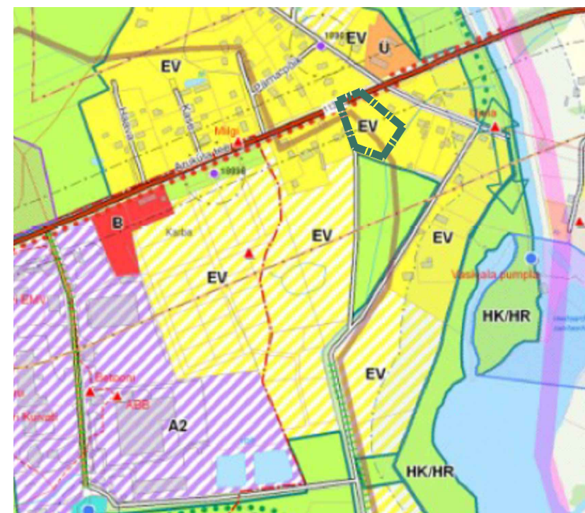
VÄLJAVÕTE RAE VALLA JÜRI ALEVIKU JA SELLEGA PIIRNEVATE AAVIKU, VASKJALA JA KARLA KÜLA ÜLDPLANEERINGU KAARDIST