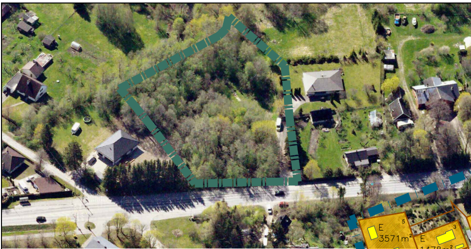
VAADE PLANEERINGUALALE PÕHJAST